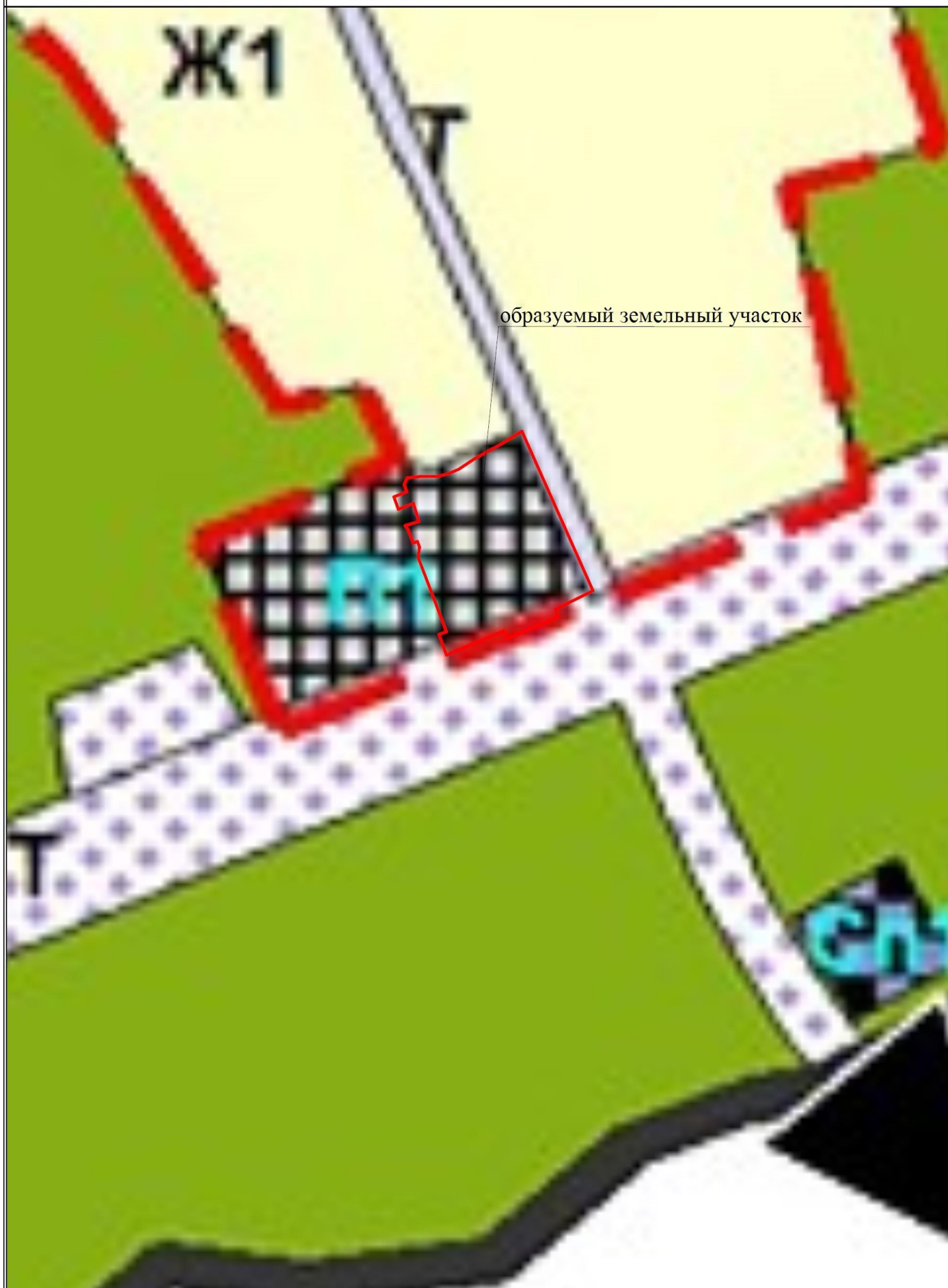
Схема расположения объекта